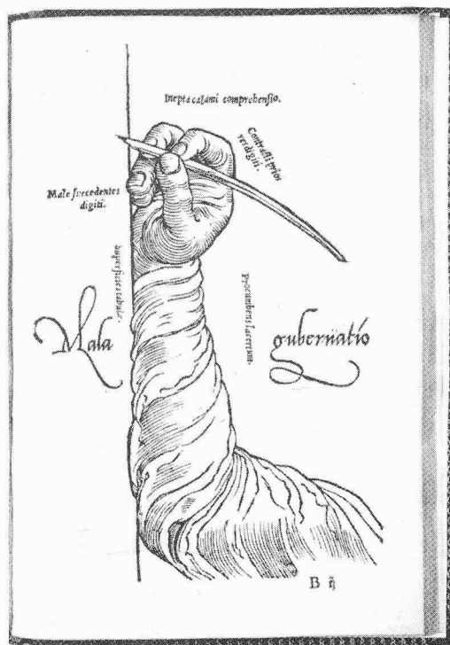
Slechte penvoering. Uit: Gerard Mercator 'Litterarum Latinarum, quas italicas cursoriasque vocant', Antwerpen, 1549, afgebeeld in MERCATOR.

Nadere gegevens en aanvraagformulieren bij Dr E.S. Leedham-Green, Cambridge University Library, West Road, Cambridge CB3 9DR, Eng-land. Sluiterstermijn is 30 November 1994.